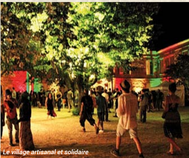
Le village artisanal et solidaire