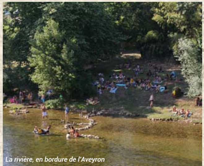
La rivière, en bordure de l'Aveyron