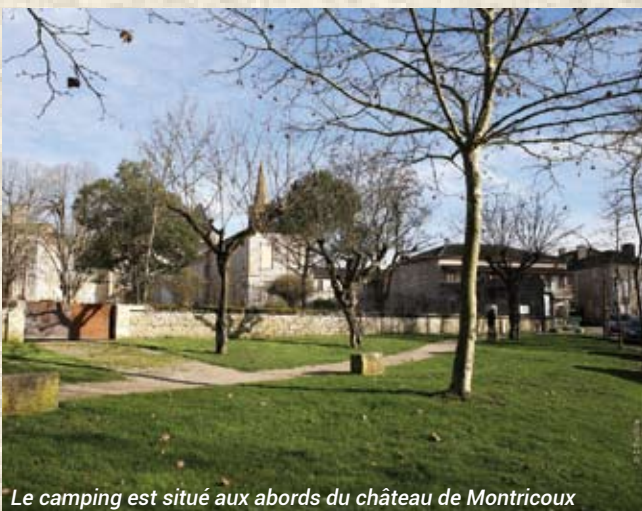
Le camping est situé aux abords du château de Montricoux

Minimiser les déplacements, sensibiliser les festivaliers à la [sur]consommation de produits psychoactifs (alcool, cannabis, autres substances) et aux risques liés à celle-ci (routiers, auditifs, sexuels) est une priorité sur un événement qui se voit accueillir plus de trois mille personnes.